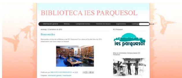
Actividades Extraescolares del IES Parquesol